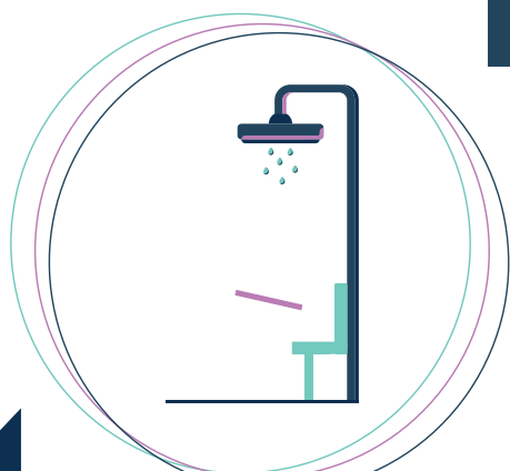
Bac à douche extra plat et extra large avec barres de maintien et siège de douche