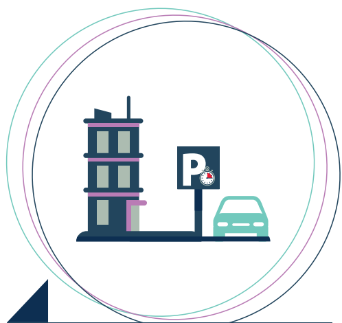
Arrêt minute réservé senior