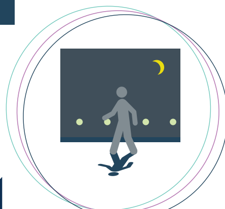
Chemins lumineux de la chambre jusqu'aux toilettes et à la salle de bain