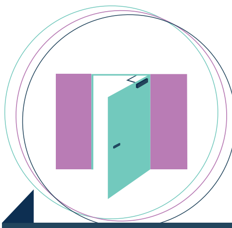
Porte d'entrée du hall automatisée